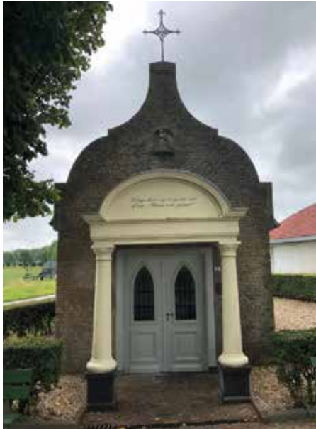
Kapel van Onze Lieve Vrouw der Zeven Weeën Kapelstraat 51, Megen