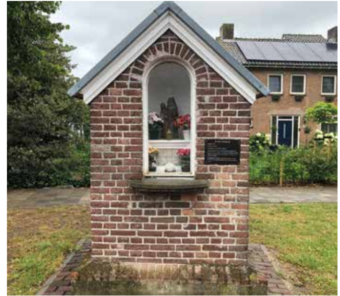
Wegkapelletje St. Anna te Drieën Tegenover Kapelstraat 26, Megen